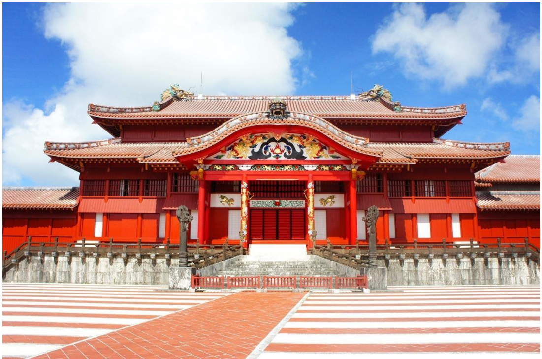
首里城正殿 国営沖縄記念公園（首里城公園）